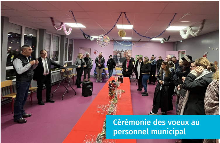
Cérémonie des vœux au personnel municipal