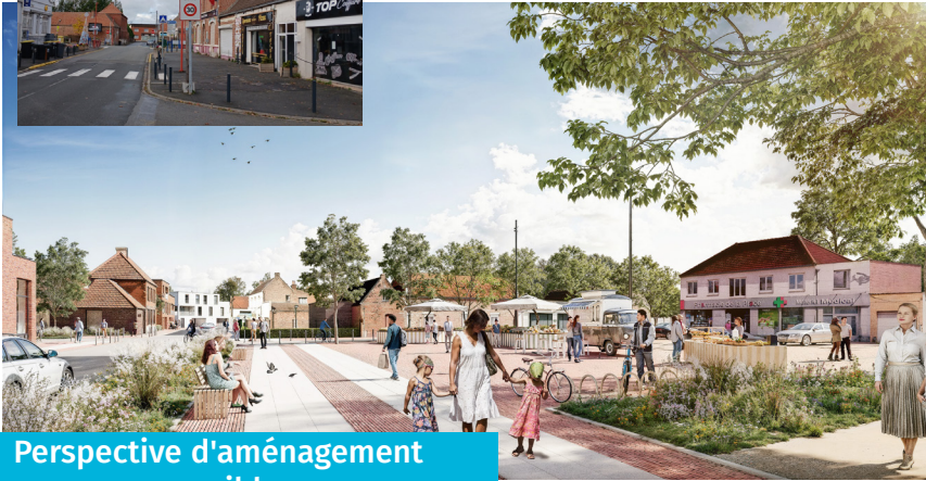
Perspective d'aménagement possible

C'est un projet de long terme qui se profile et qui avance : la transformation complète du centre-ville afin d'en faire un lieu de vie agréable et dynamique pour notre ville.