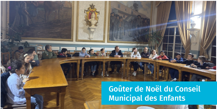
Goûter de Noël du Conseil Municipal des Enfants