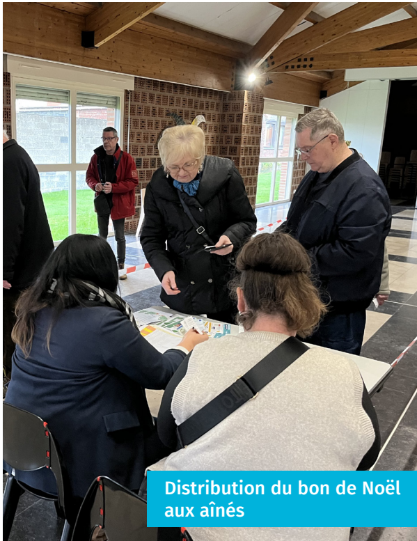
Distribution du bon de Noël aux aînés