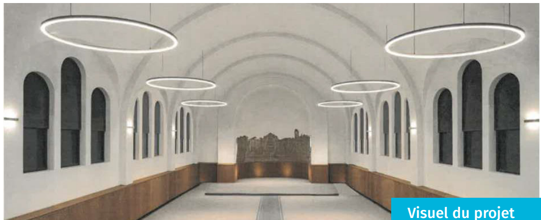
Visuel du projet

Pour rappel, ce nouvel espace sera en mesure d'accueillir des résidences artistiques, des expositions et des